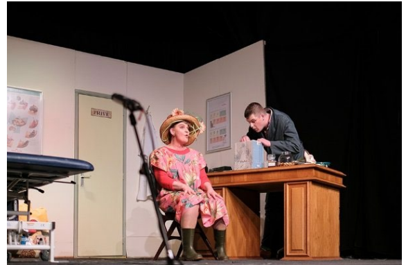
Voorstelling Westermartoeniel in It Haske (februari 2020).

Het Westermartoeniel is een onderdeel van de buurtvereniging Westermar. Onze toneelploeg bestaat uit een hele fijne ploeg mensen, waarvan er velen zijn die zich hiervoor al jaren inzetten. Het bestuur van de buurtvereniging en de mensen van de toneelploeg hebben eigenlijk nog weinig beeld van een Brûsplak. Wij vinden het daarom heel lastig om aan te geven wat de komst van een Brûsplak voor ons betekent. Wel zijn we gewend om repetitieruimten te delen met de andere toneelploegen en dat gaat altijd soepel.