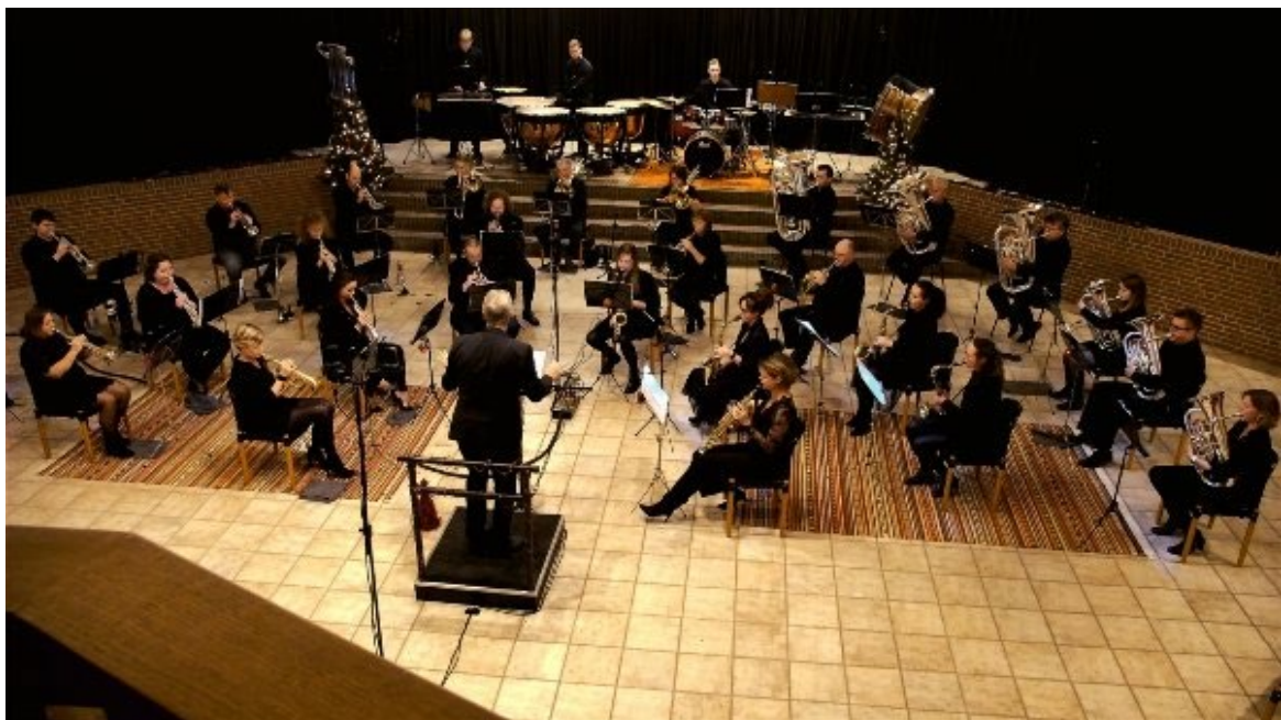
Jouster Fanfare, adventsconcert 2020, vlak voor de lockdown genomen.